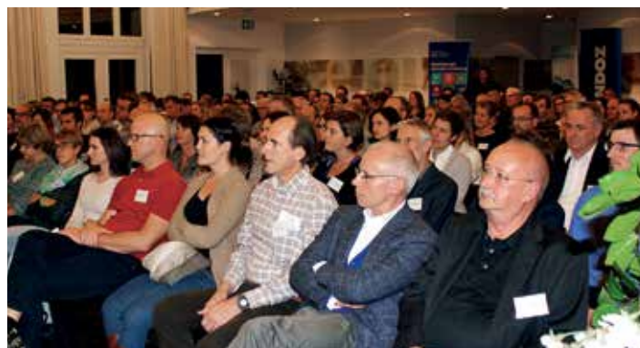
150 interessierte Zuhörerinnen und Zuhörer an der UpDate-Veranstaltung

Diese massgeschneiderte Kommunikationsplattform für die Arztpraxen wurde von BlueCare entwickelt. Mehrere Praxen von Grisomed Mitgliedern waren an den Praxistests und der Optimierung der Plattform aktiv beteiligt und konnten den Entwicklern von BlueCare wichtige Inputs für Anpassungen geben. Die Homepage http://www.bluecare.ch/produkte/blueconnect gibt dazu umfassend Auskunft.