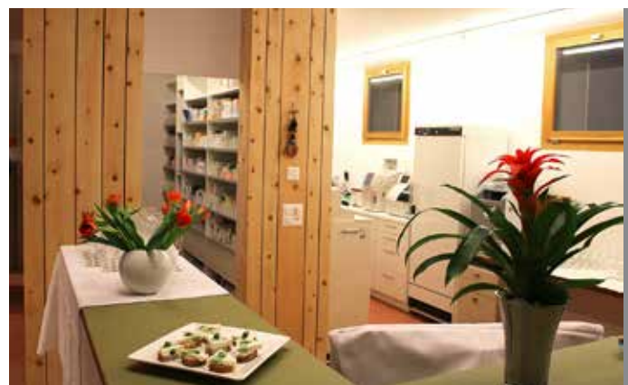
Apéro im Eingangsbereich am Tag der offenen Türe in der Pratcha Zernez