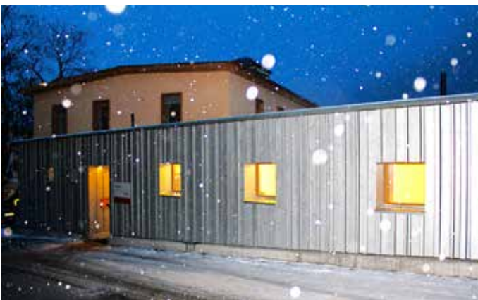
Abendstimmung vor der Pratcha Zernez