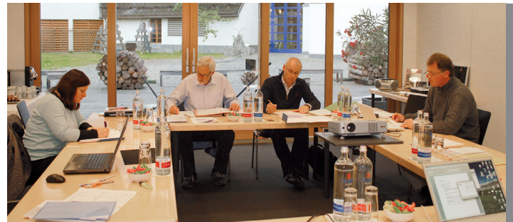
Retraite 2012 des Grisomed Verwaltungsrats

Anlässlich der Update-Veranstaltung vom 9. November 2011 wurde ein von Grisomed entwickeltes Meldesystem für kritische Zwischenfälle vorgestellt. Dieses Tool zur Erhöhung der Patientensicherheit sowie zum Erkennen, Verwalten und Beheben von Fehlerquellen wurde im Jahr 2012 durch eine Kommentarfunktion ergänzt und kann als Hilfsmittel für die Besprechung der Fälle in den einzelnen Qualitätszirkeln verwendet werden.