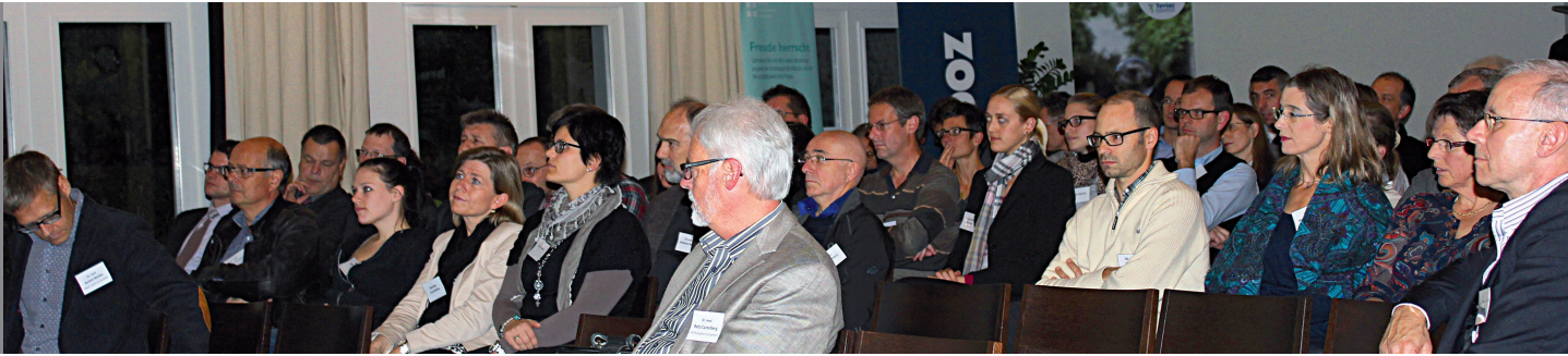
UpDate-Veranstaltung, November 2012